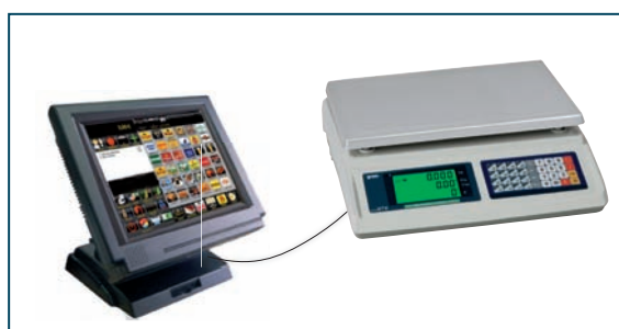
Conexión a TPV